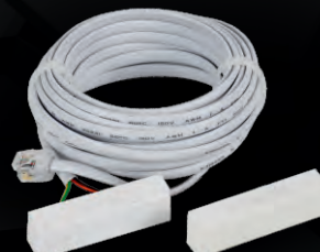
датчик открытия двери