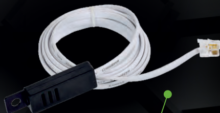
датчик температуры и влажности