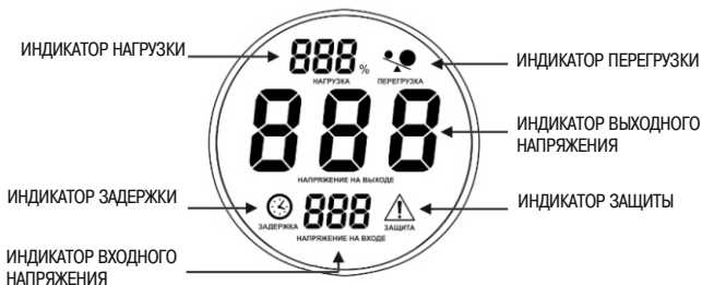
Рисунок 3 – Индикация режимов работы стабилизатора

3.5 На передней панели корпуса стабилизатора расположен дисплей, отображающий режимы работы. Значение выходного напряжения отображается с точностью, указанной в таблице 2.