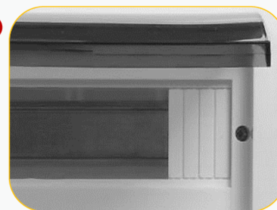
Заглушка 1/2 модуля