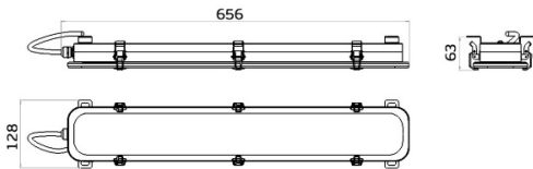
Рисунок 1 Светильник «L-sub 25»