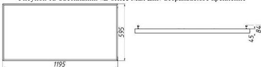
Рисунок 1б Светильник «L-office Max Ep» подвесное крепление