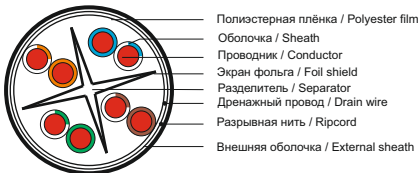
Рисунок 3 – Конструкция кабеля типа F/UTP / Figure 3 – Cable design of F/UTP type