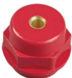
Изоляторы шинные SM